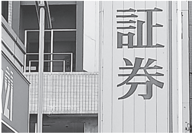
国債や地方債などで基金運用を